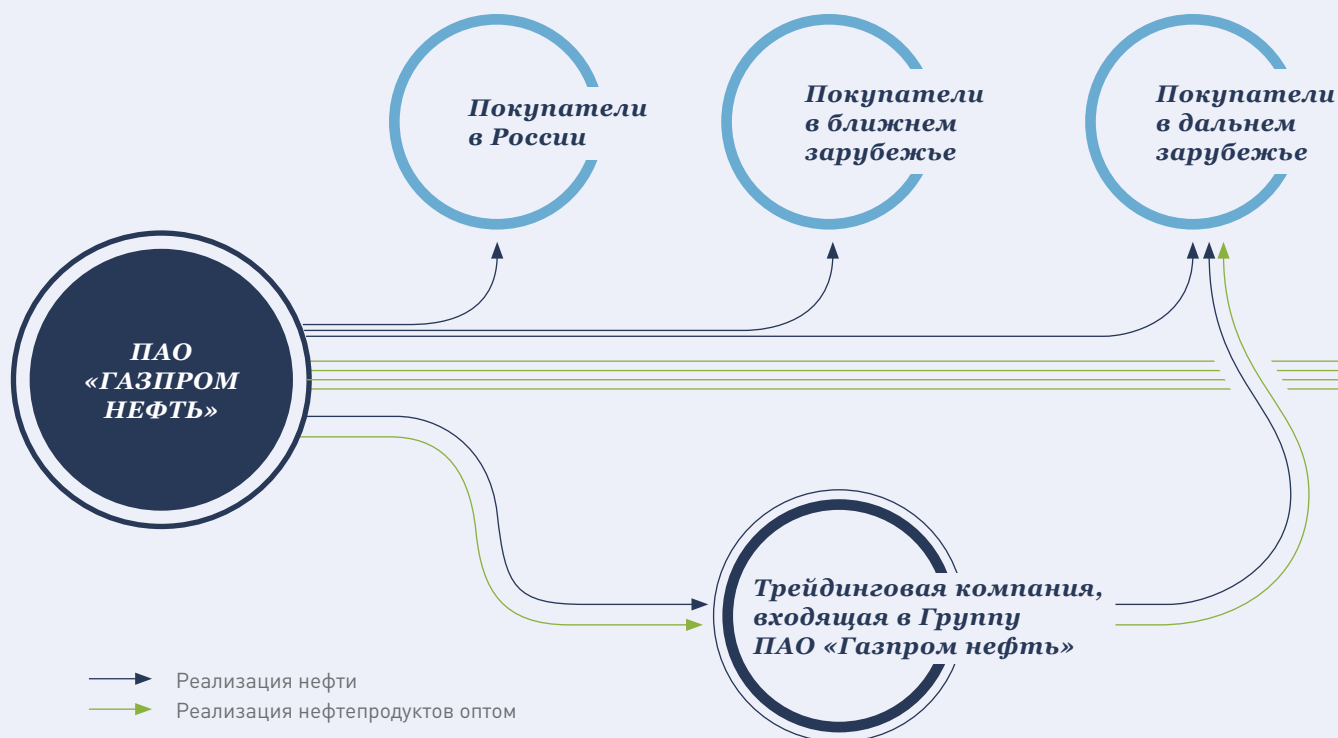
СХЕМА СБЫТА НЕФТИ И НЕФТЕПРОДУКТОВ

Ранее «Газпром нефть» завершила формирование флота, предназначенного для обслуживания арктических месторождений Компании. В транспортировке арктической нефти задействованы два ледокола нового поколения класса Icebreaker 8 – «Александр Санников» и «Андрей Вилькицкий», построенные по заказу